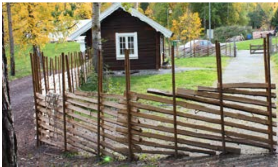
Hole Historielag fikk 75 000 kroner til utbedring av bygdetunet på Sundvollen.

SpareBank 1-stiftelsen Ringerike skal sikre at kapitalen som ble opparbeidet i Ringerikes Sparebank gjennom mer enn 175 år, forblir i lokalsamfunnet. SpareBank 1-stiftelsen Ringerikes arbeid er å forvalte midlene, og sørge for å bidra til økt kreativitet, positivitet og vekst i lokalsamfunnet.