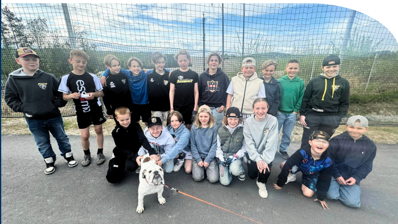
En ivrig dugnadsgjeng fra HSK Fotball G11.

Plastdugnaden var et nytt konsept som stiftelsen bidro til å dra i gang på Ringerike sammen med Handelens Miljøfond. I Ringerike og Hole deltok 855 barn og ungdommer. De bidro med 2 565 dugnadstimer og innsamling av 50 sekker plastsøppel. I sum arbeidet disse ungdommene inn 428 000 kroner i gaver til sine lag og foreninger.