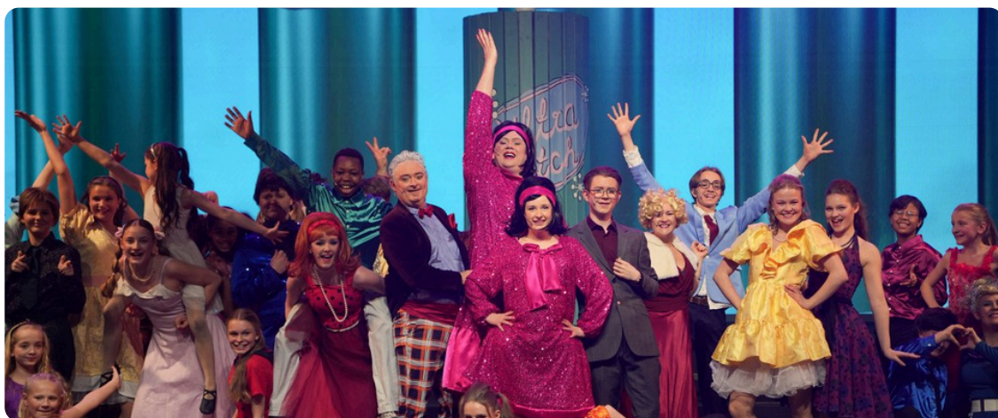
MusikalKollektivet fikk en gave på 200 000 kroner, for å invitere skoleelever til musikalen Hairspray. Bildene er fra premieren i 2026.

Målet om å ha fem års normale gaveutdelinger en er ført i balansen som Annen formålskapital med selvpålagte restriksjoner.